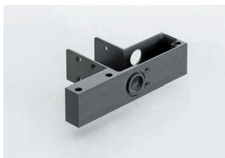
Gefrästes Gehäuse des Verschlussbolzen