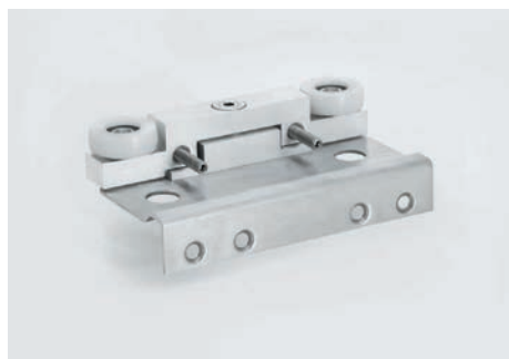
Oberer Führungswagen aus V4A und eloxiertem Aluminium

Das maritime System hat bei Salzsprühnebeltests technisch wie optisch wesentlich bessere Resultate erzielt als die Standard-Ausführung.