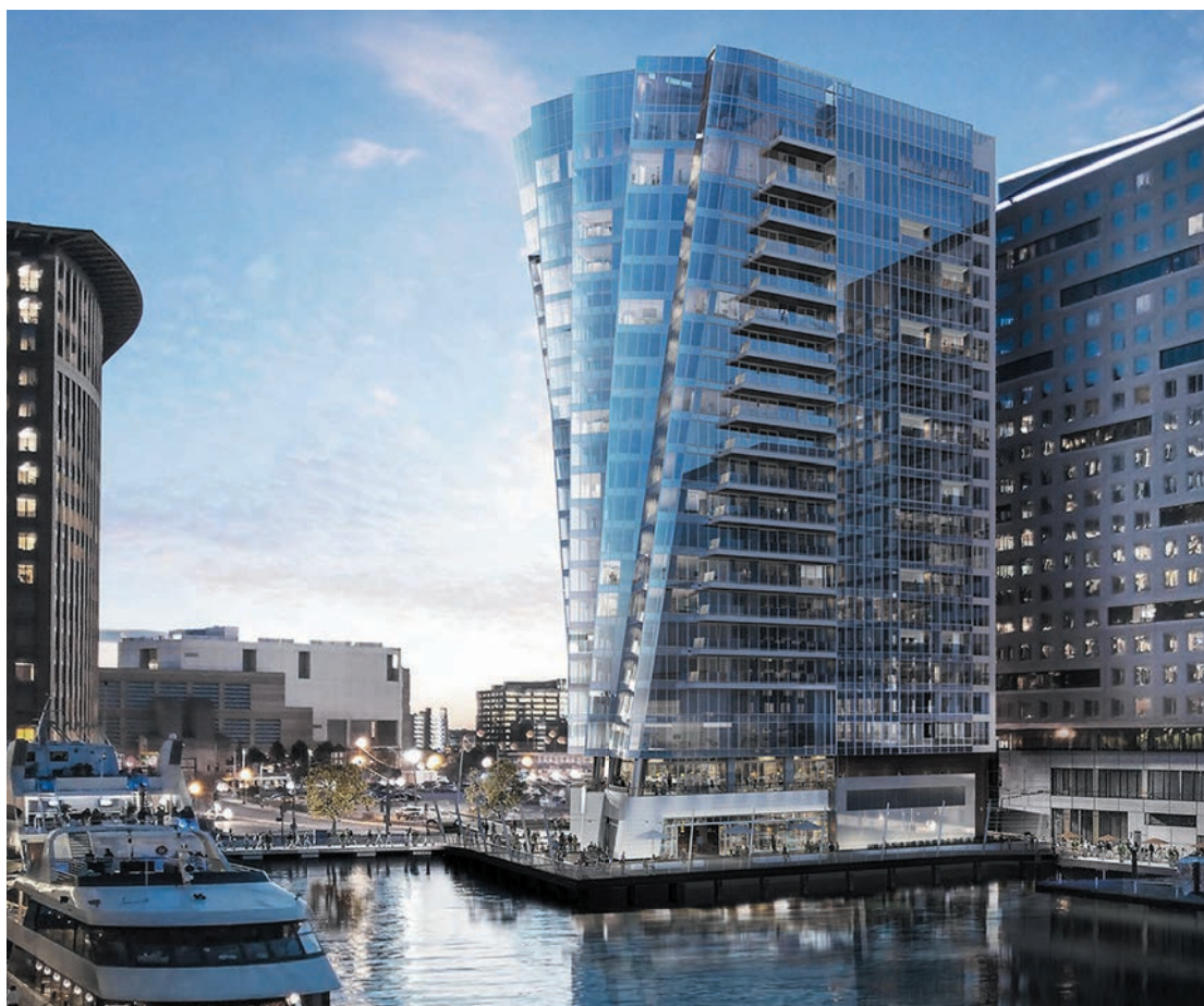
Boston, USA Hochhaus, 50m vom Meer entfernt

1. Land, 2. Stadt, 3. Industrie und 4. Meer Die Meeratmosphäre gilt aufgrund der Anreicherung der Luft mit Salz als die aggressivste Form. Alles was näher als 5km zum Meer liegt ist laut Definition «Meeresgebiet» und der aggressiven Atmosphäre ausgesetzt.