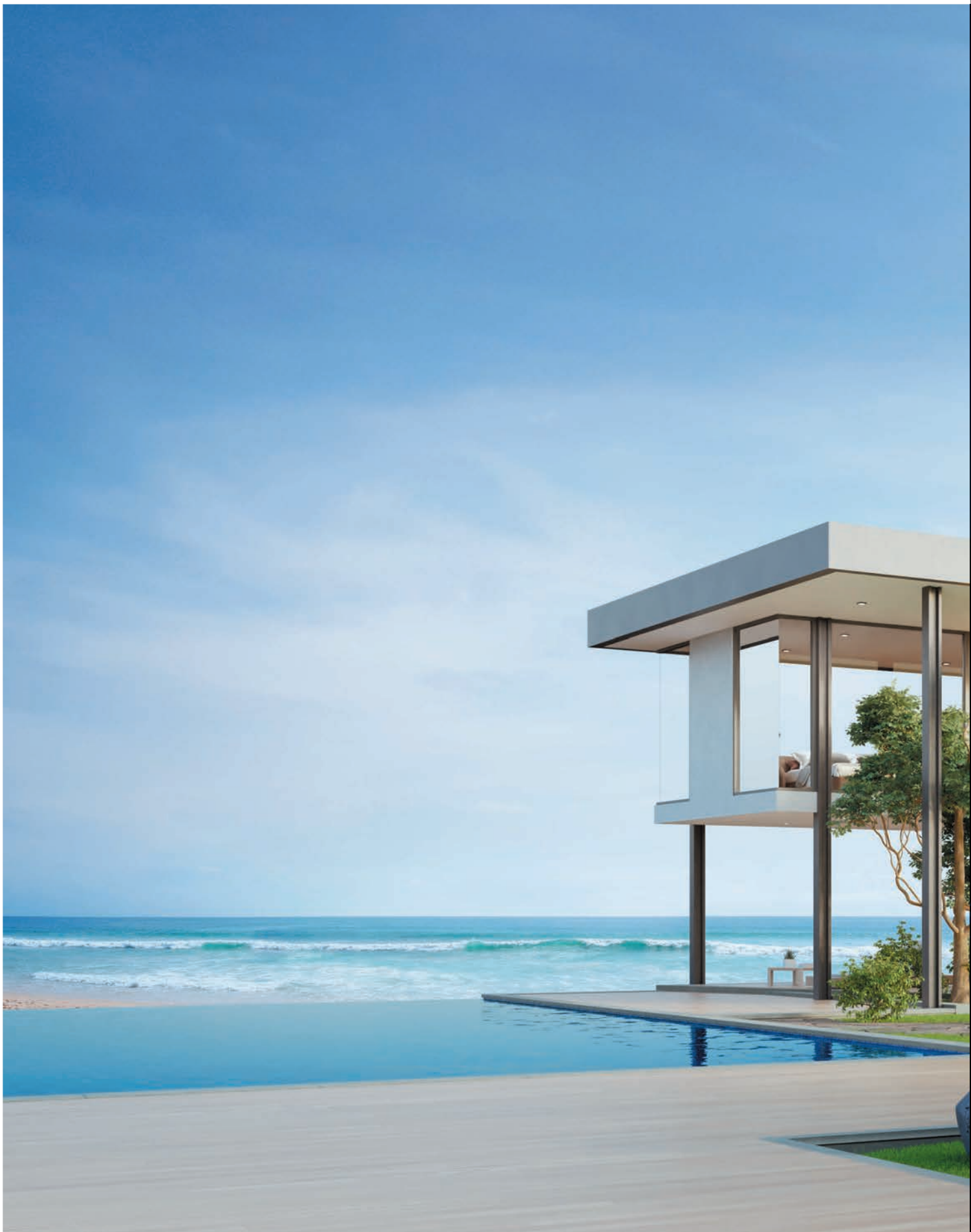
Langebaan, Südafrika Privathaus, 100 m vom Meer entfernt