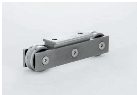
Laufwagen aus V4A und gehärteten Rollen